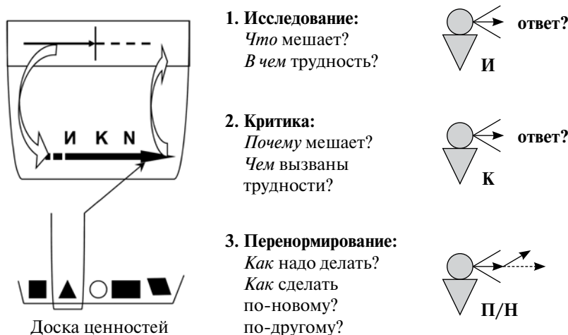
Рис. 2. Поиск решения проблемы человека с разумным (рефлексивным) мышлением

Прежде всего человек начинает исследовать ситуацию. Стадия «Исследование» дает ему возможность ответить себе на вопросы: Что мешает достичь результата? В чем заключается трудность?