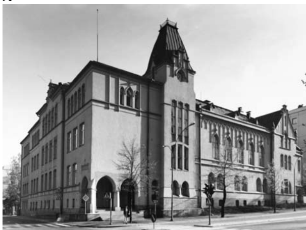
Здание школы для девочек, фасад (А) и план 1-го и 2-го этажа (В) (Тампере. 1899. Арх. В. Лённо. Архив Музея архитектуры Финляндии )