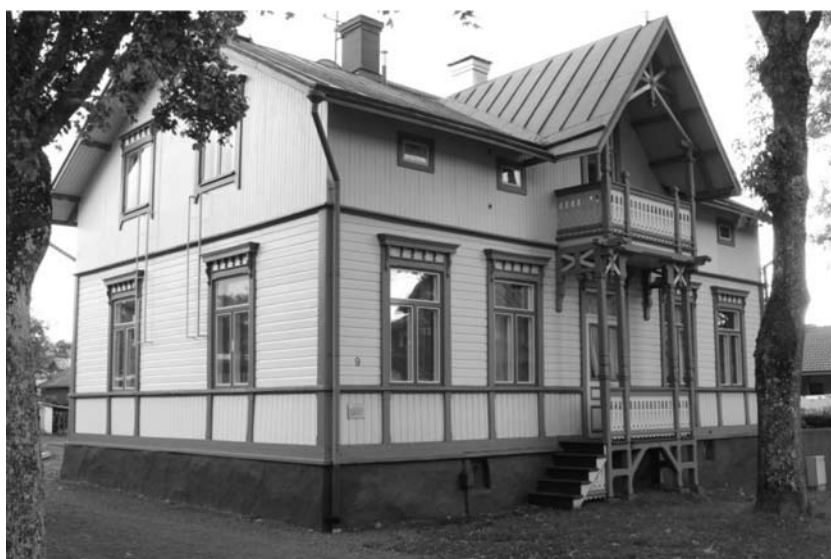
Частные виллы, современный вид (Мариехамн. 1890-е годы. Арх. Х. Хонгелл)