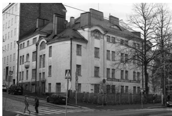
Здание музыкальной школы «Ebenezер», современный вид (Хельсинки. 1908. Арх. В. Лённо)