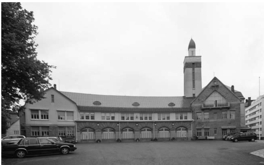
Главная пожарная часть, современный вид (Тампере. 1907. Арх. В. Лённ)