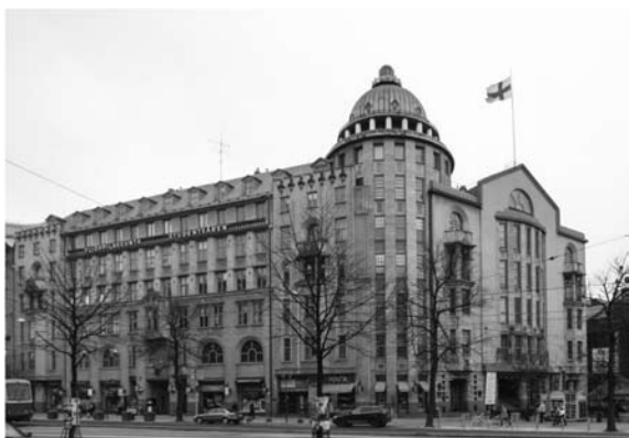
Здание Нового студенческого клуба, современный вид (Хельсинки. 1907. Арх. А. Линдгрэн, В. Лённо)

стала стартовой вехой в становлении финской национальной архитектурной школы. И, наконец, их успешная профессиональная деятельность вела к изменению отношения общества к женщинам-архитекторам.