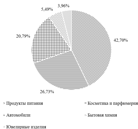
Рис. 1. Процентное соотношение предметных областей рекламных текстов с эстетической функцией Fig. 1. Percentage ratio of subject areas of advertising texts with an aesthetic function

вид и отношение окружающих к нему может также измениться в лучшую сторону. Чуть меньшее количество рекламных текстов с эстетической функцией представляет предметную область «автомобили» (20,79 %), вероятно, причиной этого является тот факт, что теперь машина – это не только необходимое транспортное средство, но и способ выразить свои предпочтения. В предметную область «бытовая химия» входит 5,49 % текстов с рассматриваемой функцией, что, вероятно, объясняется тем, что она не связана напрямую с концептом «красота», однако товары данной области могут содействовать потребителю в создании более привлекательного образа. Наименьшее количество текстов с эстетической функцией представляет предметную область «ювелирные изделия» (3,96 %). Думается, это связано с тем, что, несмотря на ее прямое отношение к красоте, ювелирные изделия редко рекламируют в видеороликах, для распространения чаще используются только визуальные средства.