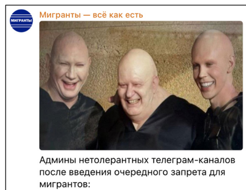
Рис. 1. Мем в новостном телеграм-канале. Источник https://t.me/migranty_RUS/4221 , дата доступа 02.05.2024 г. Fig. 1. Meme in a news telegram channel. Source https://t.me/migranty_RUS/4221 , accessed on 05/02/2024

Ср.: Админы нетолерантных телеграм-каналов после введения очередного запрета для мигрантов . Модератор визуализирует реакцию на политическую инициативу губернатора Курской области запретить мигрантам работать в такси (май 2024 г.). Это осуществляется посредством