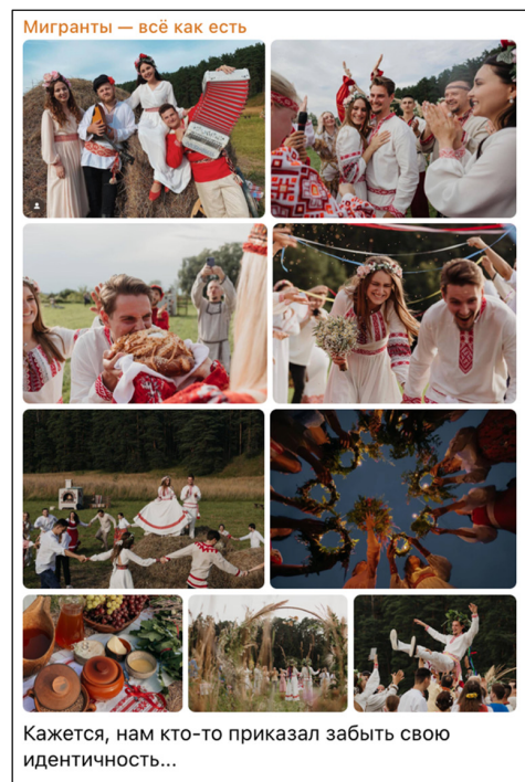
Рис. 4. Праздник в национальных костюмах. Источник https://t.me/migranty_RUS/3263 , дата доступа 11.03.2024 г. Fig. 4. Celebration in national costumes. Source https://t.me/migranty_RUS/3263 , accessed 11.03.2024

акробаты и гимнасты в русских народных костюмах: Вот вам ещё порция русской красоты на вечер ; референт изображения — девушки в национальных костюмах, танцующие хоровод: Сегодня состоится прекрасный русский праздник для всех, который пройдёт в Измайловском Кремле...