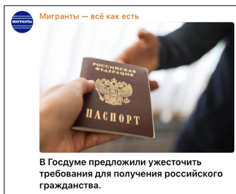
Рис. 2. Изображение российского паспорта в новостном телеграм-канале.